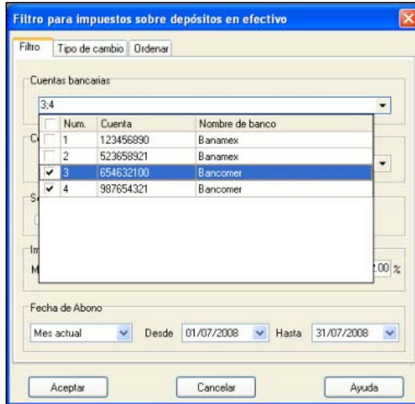
Figura 2. Filtro Cuentas Bancarias